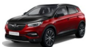
GRANDLAND X PHEV (Híbrido Enchufable) 21% DTO. //