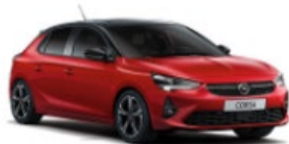
NUEVO CORSA 30% DTO. //