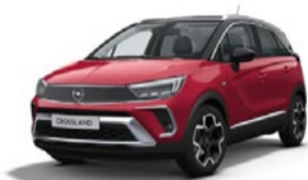
NUEVO CROSSLAND 25% DTO. //