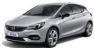
NUEVO ASTRA 25% DTO. //