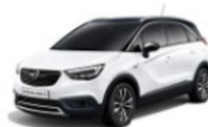
CROSSLAND X 25% DTO. //