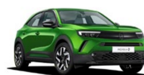
NUEVO MOKKA-e 18% DTO. //