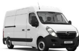
MOVANO 36% DTO. //