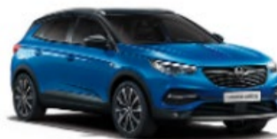
GRANDLAND X 25% DTO. //