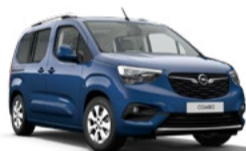
COMBO LIFE 37% DTO. //