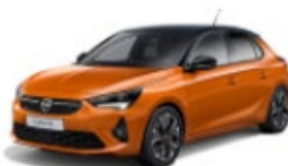
CORSA-e 14% DTO. //