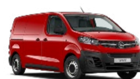
VIVARO 38% DTO. //