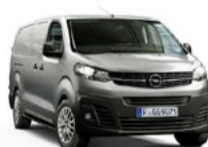
VIVARO-e 29% DTO. //