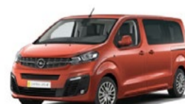
ZAFIRA LIFE-e 28% DTO. //