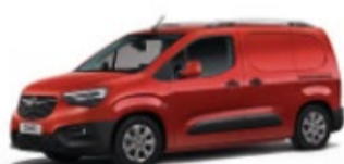
COMBO CARGO 39% DTO. //