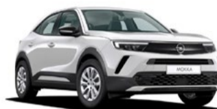
NUEVO MOKKA 20% DTO. //