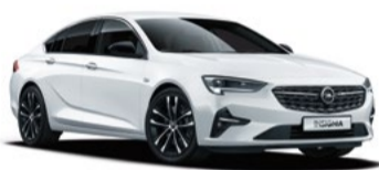
NUEVO INSIGNIA 30% DTO. //