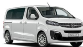
ZAFIRA LIFE 30% DTO. //